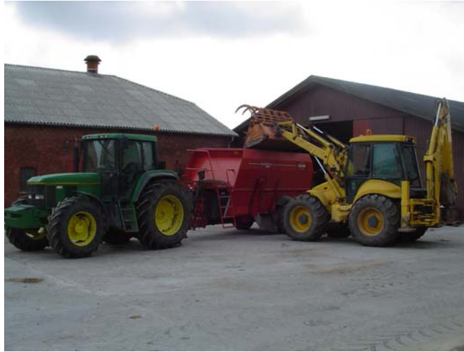
Typisk "traditionel løsning"

Med en læsemaskine, fuldfodervogn og traktor har man en yderst fleksibel maskinpark. Læsemaskinen kan anvendes til utallige arbejdsopgaver i det daglige. Er læsemaskinen en frontlæsser traktor, kunne den også anvendes i spidsbelastningsperioder i marken. Det samme gør sig gældende for traktoren der står for fuldfoderblanderens. Den selvkørende fuldfoderblander kan derimod kun anvendes til læsning og udfodring, hvilket sætter sine begrænsninger. Desuden kan den ikke læsse foder fra markstak, som hovedsageligt skyldes manglende fire hjulstræk og en typisk dårlig dæk montering som kun kan anvendes på fast underlag.