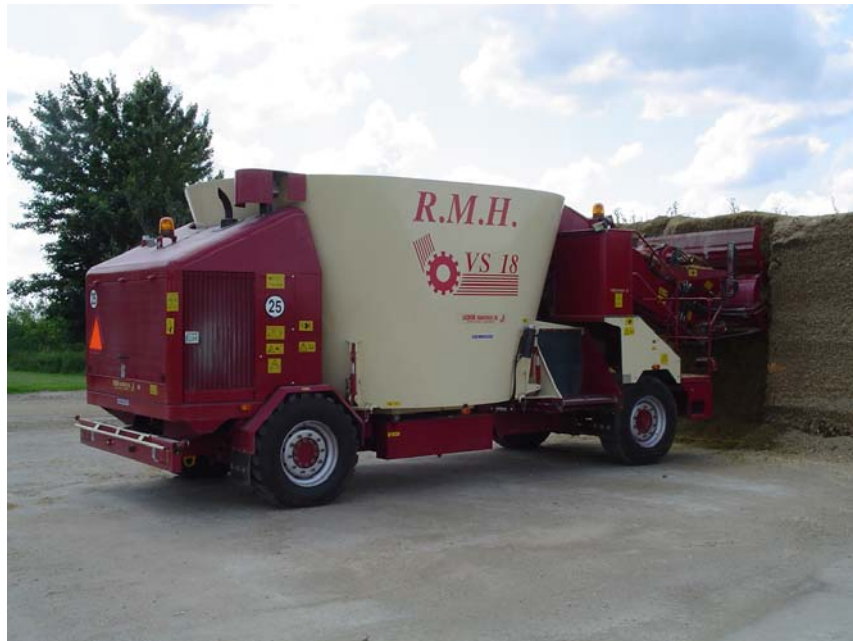
Læsning af grovfoder med selvkørende fuldfoderblander, bemærk det rene snit i stakken.

Der er taget udgangspunkt i en besætning på 200 årskøer og dertilhørende opdræt af kvier der fodres med en traditionel løsning bestående af læsemaskine, fuldfoderblander og traktor. Der er kalkuleret med et foderforbrug på 7300 FE pr år, alt afhængig af mælkeydelsen. Det samlede foderforbrug til køerne udgør 1.460.000 FE pr. år. Der er ligeledes kalkuleret med et gennemsnitligt foderforbrug på 1800 FE til opdræt af kvier. Det samlede foderforbrug til køer og dertilhørende opdræt af kvier bliver 1.820.000 FE pr. år. Med et årligt tidsforbrug til læsning og udfodring på 1100 timer, vil det sige 3 timer dagligt.